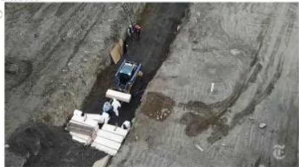
New York City hired laborers to bury unclaimed bodies on Hart Island.