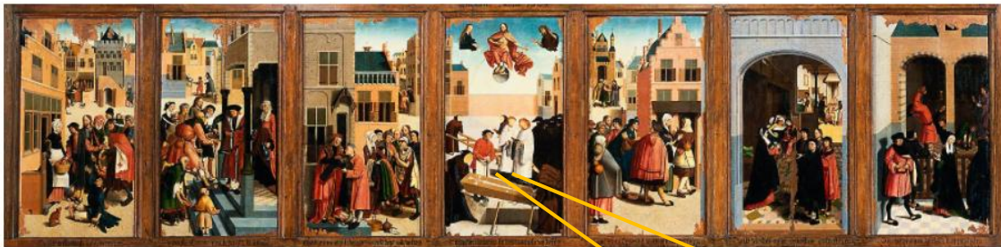
Meester van Alkmaar: De zeven werken van barmhartigheid

Tegen de achtergrond van de Middeleeuwse cultuur is het niet verwonderlijk om dit 7 e (een bijbels getal) werk van barmhartigheid in het midden van het paneel afgebeeld te zien.